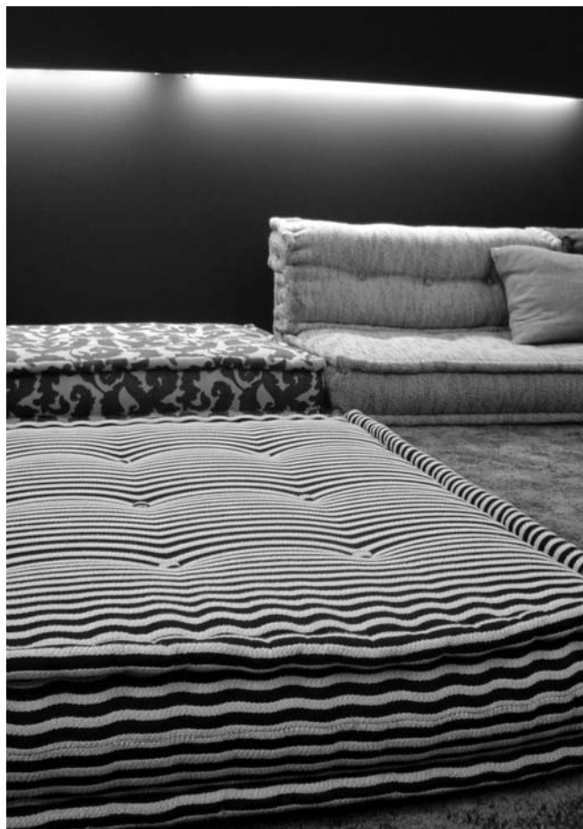
Menschen wollen vermehrt Dinge mit sinnlichem Bezug.

Und diese Berührung ist es, auf die es uns zukünftig ganz maßgeblich ankommt. Dienstleistungen, Produkte, Angebote müssen uns berühren. „High Touch“ wird zum leitenden Prinzip. Menschen, die bereits alles haben, wollen nicht immer noch mehr, sondern sie wollen Produkte mit Geschichte und mit einem sinnlichen Bezug zur eigenen Person. Der Überdruß an Massenkonsum lässt die Sehnsucht nach intensiven emotionalen Erlebnissen wachsen. Reine nutzenorientierte Angebote verblassen angesichts des Bedürfnisses nach emotionalen Erlebnissen. Ein Aufflammen naiver Muster und Motive, eine Rückkehr der glänzenden