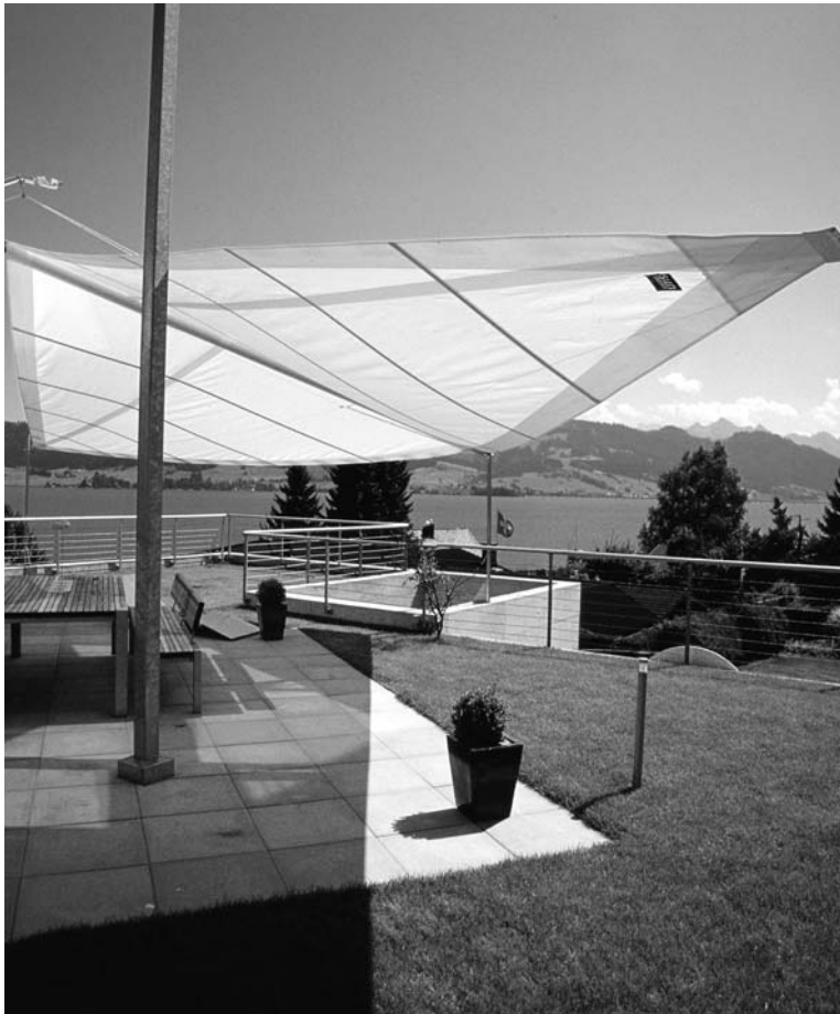
Der Garten – Freiraum und „Erdungszone“.

macht's möglich: Trotz rückläufiger Geburtenraten wird die Anzahl der Haushalte in den nächsten 15 Jahren weiter ansteigen. Laut Statistischem Bundesamt erhöht sich dabei aber nur der Anteil der über 65-Jährigen mit eigener Wohnung. So bleibt die Anzahl der unter 65-Jährigen bis 2020 ungefähr gleich hoch (26 bis 27 Millionen), während die Menge der Haushalte der über 65-Jährigen rapide ansteigen wird. Eine Generation mit ganz eigenen Ansprüchen ans Wohnen und Leben.